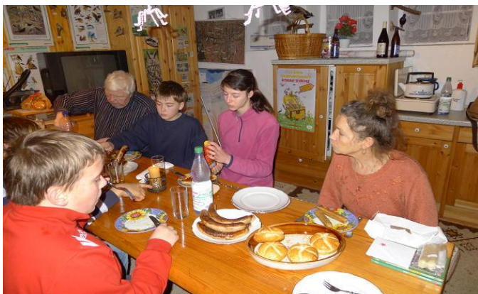
...feiern, können und machen wir auch!