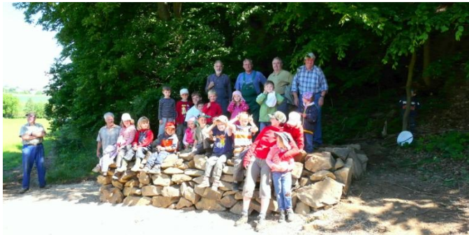
Steinmauern für Exen, Salamander und Co. bauen wir mit unserer Jugendgruppe oder wie auf diesem Bild zu sehen, mit dem Waldkindergarten.