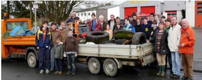
Jährlich wiederkehrende Aktionen wie Müllsammeln, Ferienpass in den Ferien mit den Schulkindern, Vogelstimmenwanderung immer am 1. Mai, Pilzexkursionen und mit der Grundschule Arbeitskreise in denen das Schützen und Pflegen der Natur gelehrt wird.