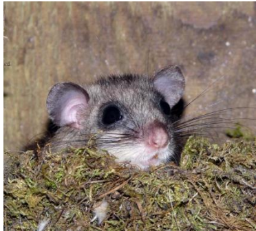
Siebenschläfer im Nistkasten.

Für Trockenmauer, Insektenhotel und Teich ist unsere Jugendgruppe die „Eisvögel“ zuständig.