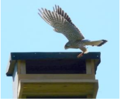
Falke auf neu erbauten Horst auf unserem Vereinsgelände