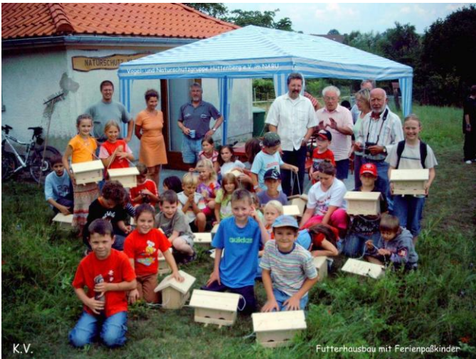
K.V. Futterhausbau mit Ferienpaßkindern

einer der erfolgreichsten Vereine. Wir bauen in den Wintermonaten die Röhren für den Steinkauz und Nistkästen für viele andere heimische Vögel selbst, oder mit Kindern aus Kindergärten und Schulen.